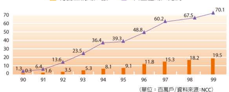
(單位：百萬戶/資料來源:NCC)