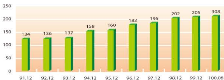
圖5：台灣ASN核發數量統計(單位：個)

自治系統號碼(ASN)是一個提供自治系統(AS)間交換動態路由資訊的唯一識別碼。截至100年8月國內自治系統號碼核發數為308個。