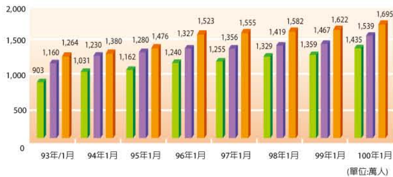
圖8：台灣上網人口統計 (單位:萬人)