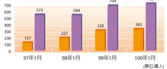
圖9：台灣12歲以上行動上網與無線上網人口統計 (單位:萬人)