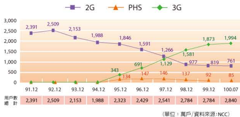
(單位：萬戶/資料來源:NCC)