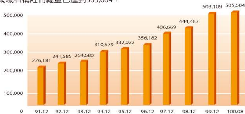
圖1：.tw網域名稱註冊成長統計(單位：個)

網域名稱(Domain Name)：指用以與網際網路位址相對映，便於網際網路使用者記憶TCP/IP主機所在位址之文字或數字組合。截至100年8月底止，.tw網域名稱註冊總量已達到505,604。