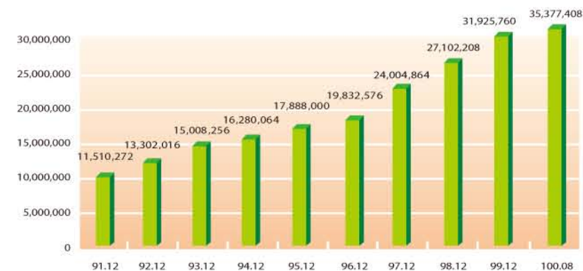
圖3：台灣IPv4位址成長統計(單位：個)

自治系統號碼(ASN)是一個提供自治系統(AS)間交換動態路由資訊的唯一識別碼。截至100年8月國內自治系統號碼核發數為308個。