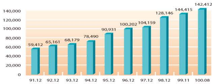
圖6：.tw WWW Server 數統計(單位:台)

.tw WWW Server數截至100年8月底共計有142,412台WWW Server。