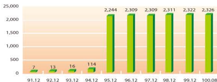
圖4：台灣IPv6位址成長統計(單位：/32)

網際網路位址(Internet Protocol Address)：指為供辨識網際網路主機號碼位置所在，以固定且單一的數字分配予主機之位址。台灣歷年來IP位址核發數量，呈穩定成長，IPv4位址發放數量統計，台灣居全球第13名；IPv6位址發放數量為全球第9名。