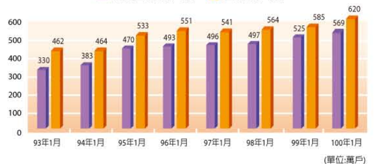
圖10：台灣上網家戶與寬頻上網家戶數統計 (單位:萬戶)